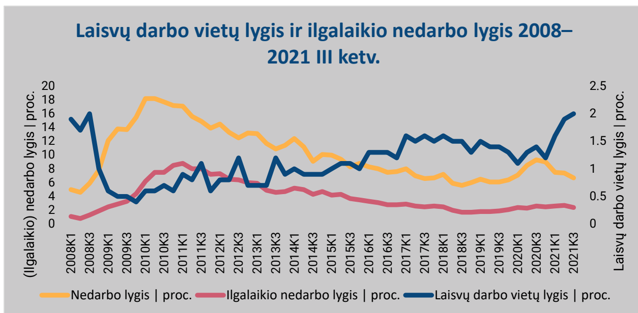
Pav.1. Laisvų darbo vietų ir ilgalaikio nedarbo lygio palyginimas