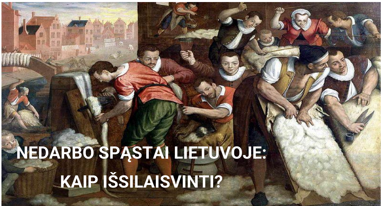
Isaac van Swanenburg