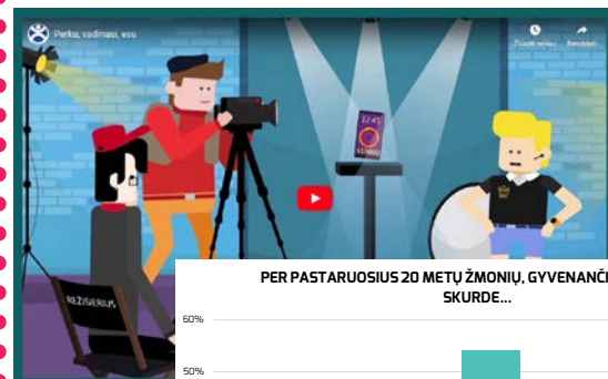
PER PASTARUOSIUS 20 METŲ ŽMONIŲ, GYVENANČIŲ VISIŠKAME SKURDE...

Siūlome naudoti internetinius įrankius, apklausas. Kiekvienoje temoje rasite specialiai temai sukurtus animacinius filmukus.